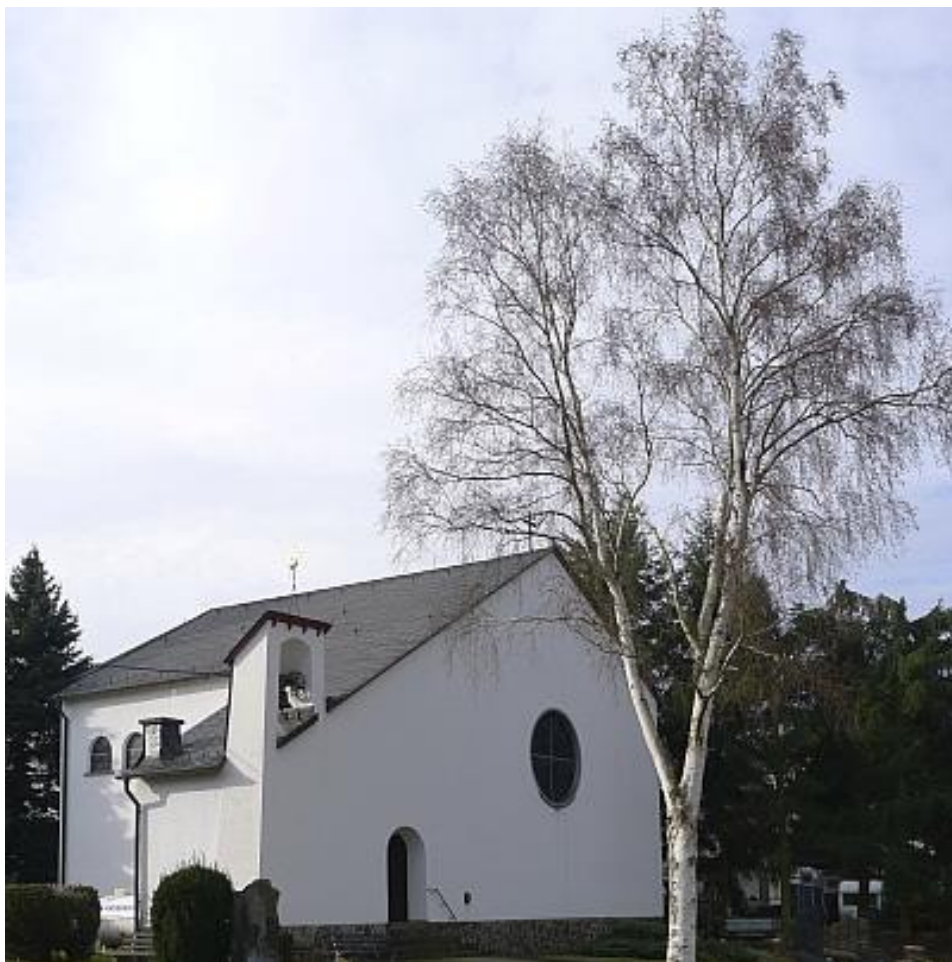
Kapelle in Zermüllen; Hl. Donatus, 30. Juni

Beinhausen | Bodenbach | Kelberg | Müllenbach | Nürburg | Retterath | Uersfeld | Uess | Welcherath 1. Juni bis 30. Juni 2016