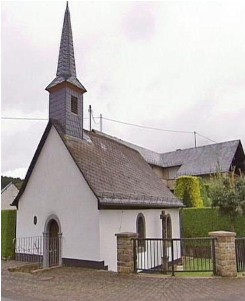
Kapelle St. Blasius, Brücktal

Beinhausen | Bodenbach | Kelberg | Müllenbach | Nürburg | Retterath | Uersfeld | Uess | Welcherath 1. Februar bis 28. Februar 2017