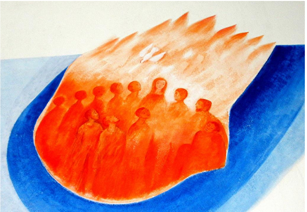
Bild: Foto: Friedbert Simon / Künstler: Polykarp Ühlein In: Pfarrbriefservice.de

Beinhausen | Bodenbach | Kelberg | Müllenbach | Nürburg | Retterath | Uersfeld | Uess | Welcherath 1. Juni bis 30. Juni 2019