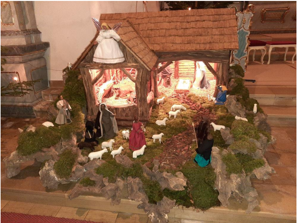
Krippe Pfarrkirche Uess Bild: Ulrike Kaster

für die Zeit vom 01.12.2020 bis 31.01.2021