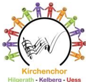
Kirchenchor Hilgerath - Kelberg - Uess